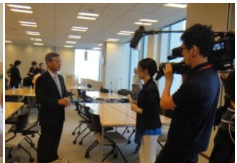
4.日経 CNBC 取材