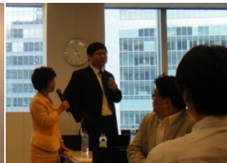
2.孫社長と質疑応答