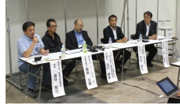
パネルディスカッションの様子