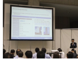
光寶動力儲能科技 プレゼンテーションの様子