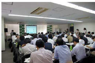
超小型モビリティ部会全景