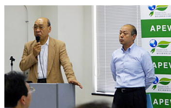
田嶋代表幹事(左)と国交省小笠原様(右)