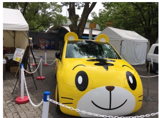
電気自動車(EV)しまじろうカー3号機