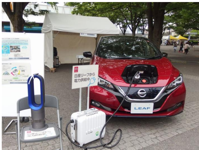
会員企業・日産自動車様のブース