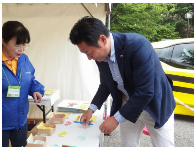
ご記入中の秋元環境副大臣