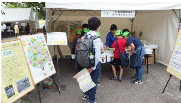
ブースで「環境によいこと宣言」をしている子どもたち 一般社団法人 電気自動車普及協会 Association for the Promotion of Electric Vehicles

多くの方々に、電気自動車への関心を高めるとともに、自分にとって環境によい行動を考えていただく機会にすることができました。