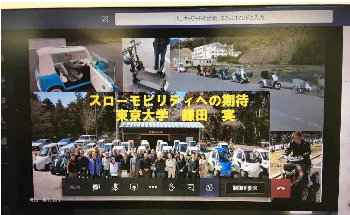
会合の様子(WEB会議室)