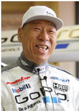
田嶋 伸博 (たじま のぶひろ)

90 回の歴史の中で、日本人が総合優勝を果たしたのは7回。いずれも優勝者は田嶋伸博。田嶋の初優勝は 1995 年。そして 2006 年から 2011 年まで 6 連覇中。今年 62 歳を迎える田嶋は今も世界で最も速い男としてパイクスピークに君臨している。