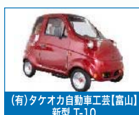
(有)タケオカ自動車工業【富山】 新型 T-10