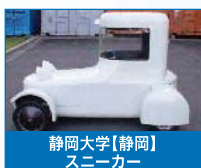
静岡大学【静岡】 スニーカー