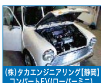
(株)タカエンジニアリング【静岡】 コンパクトEV(ローバミニ)