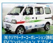
(株)タジマモーターコーポレーション【静岡】 EVコンバージョン エブリイ