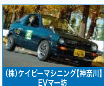
(株)エイビーマシンング【神奈川県】 EVマー坊