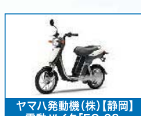
ヤマハ発動機(株)【静岡】 電動バイク「EC-03」