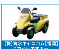
(株)筑水キャニコム【福岡】 おでかけですカー