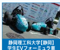
静岡理科大学【静岡】 学生EVフォーミュラ車