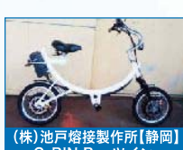
(株)池戸熔接製作所【静岡】 G-RIN Beeツイン