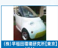
(株)早稲田環境研究所【東京】 ULV