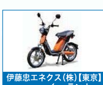
伊藤忠エネクス(株)【東京】 e-runner イーランナー