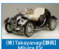
(株)Takayanagi【静岡】 Miluir EV