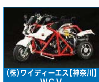
(株)ワイティエス【神奈川県】 WC V