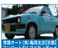
常陸オート(株)亀岡支店【京都】 コンパクトEV マイティボーイ