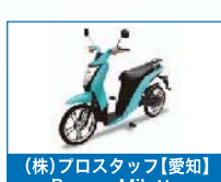
(株)フロスタッフ【愛知】 Prozza Miletto