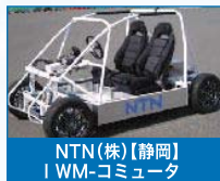
NTN【静岡】 IWM-コミュニータ