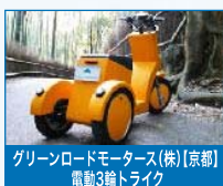
グリーンロードモータース(株)【京都】 電動3輪トライク