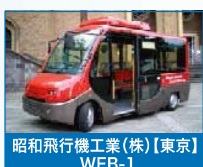
昭和飛行機工業(株)【東京】 WEB-1