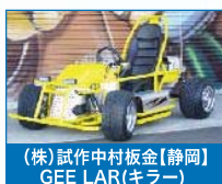
(株)試作中村板金【静岡】 GEE LAR(キラ)