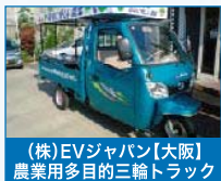
(株)EVジャパン【大阪】 農業用多目的三輪トラック