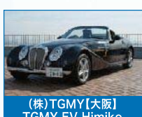
(株)TGMY【大阪】 TGMY EV Himiko