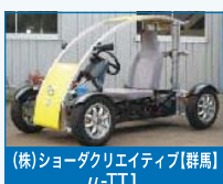
(株)ショーダクリエイティブ【群馬】 μ-TT1