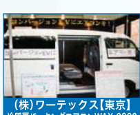
(株)ワーテックス【東京】 冷暖房パーキングエアコンWAX-0920