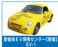
愛媛県EV開発センター【愛媛】 EV-1