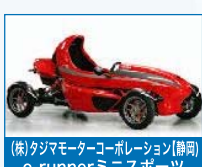
(株)タジマモーターコーポレーション【静岡】 e-runnerミニスポーツ