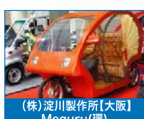
(株)淀川製作所【大阪】 Meguru(環)