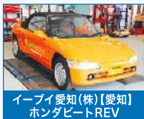
(株)イービー愛知【愛知】 ホンダビートREV