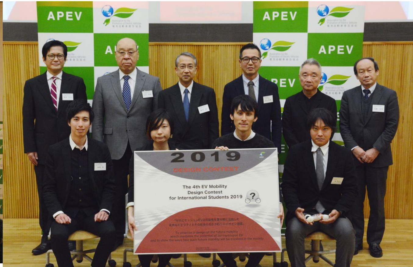
全員での記念撮影