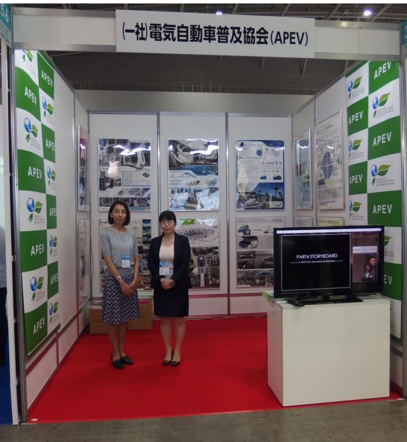
APEVブースの全体の様子