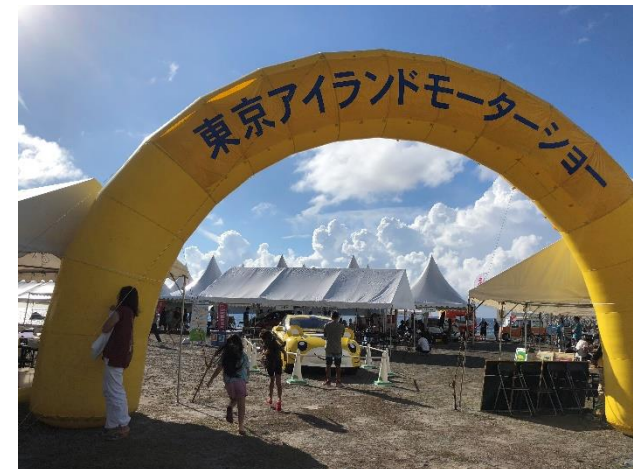
EV「しまじろうカー」を展示やワークショップにて「環境によいこと宣言」