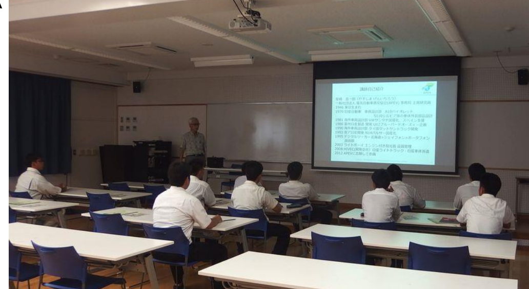
講義やワークショップの様子→