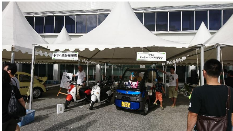
APEV会員企業様の展示やEV乗も大人気！