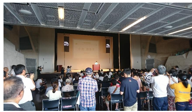
小池都知事もご来場