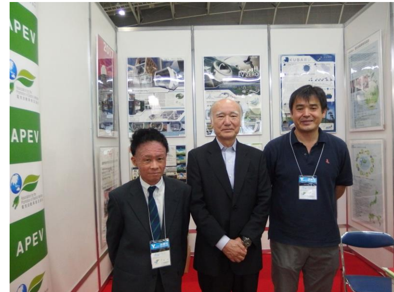
日本自動車レース工業会 鮎子田会長来訪