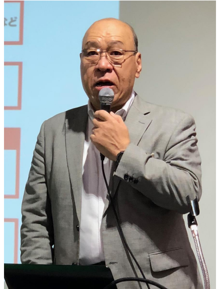
田嶋代表理事の講演は「EVが切り拓く未来について」 5