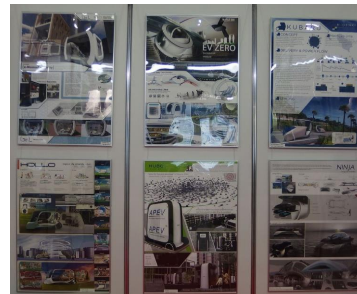
デザインコンテスト作品展示→