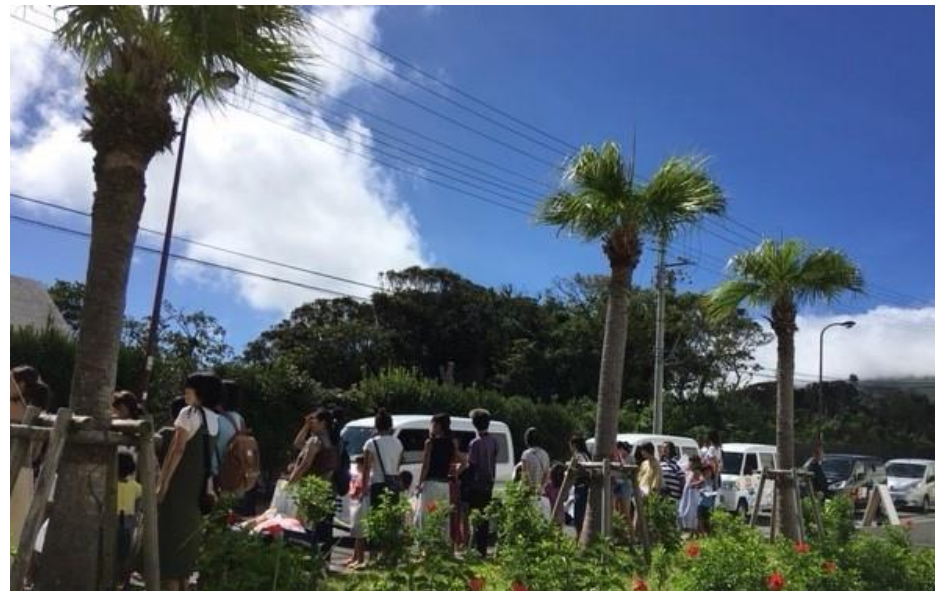
企画アドバイス、八丈島でのEVラリーのコース設定や参加者募集などの協力

EVを気軽に「見て」「触れて」「体験して」いただきEVの「良さ」「楽しさ」を知っていただきました！