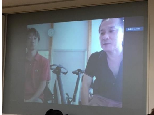
トヨタ自動車 杉山主幹