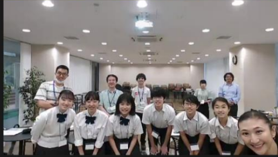
ご参加いただいた高校生とTA留学生、講師、スタッフの皆様 (最後だけマスクを外して無言で記念撮影)