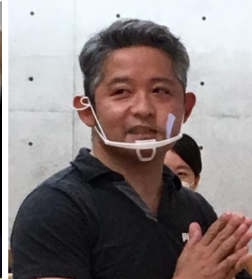
日本パラ陸上競技連盟 花岡副理事長