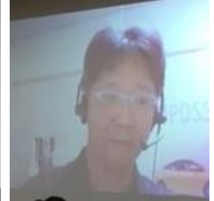
覚知GM トヨタ自動車 豊島副本部長