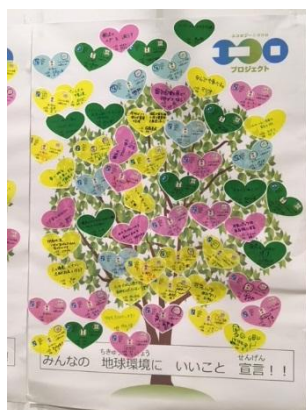
出来上がった宣言ポスター