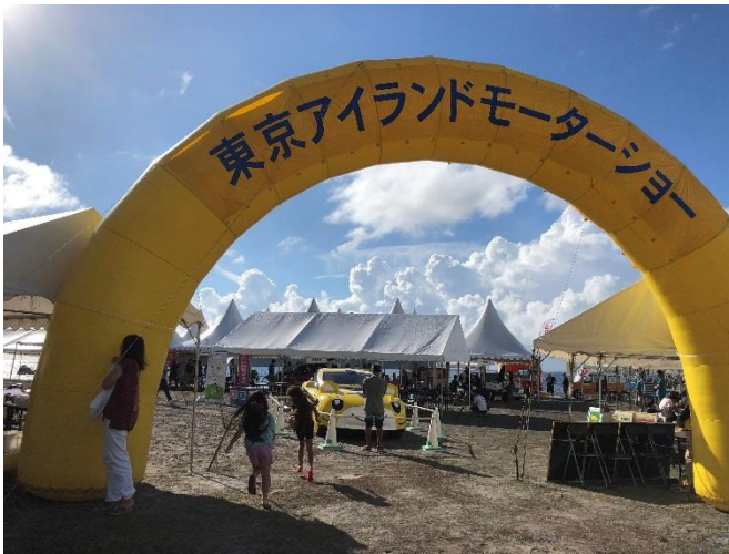
東京アイランドモーターショー入口に入るとスグ目に入るEVしまじろうカーと駆け寄る子どもたち