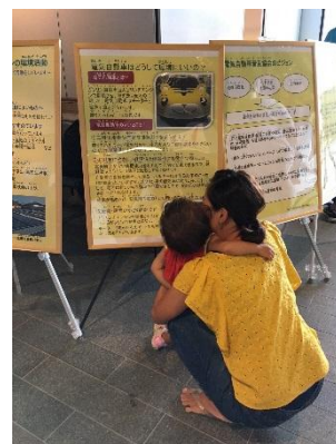
電気自動車が地球環境によい説明ポスターをご覧になっている方々