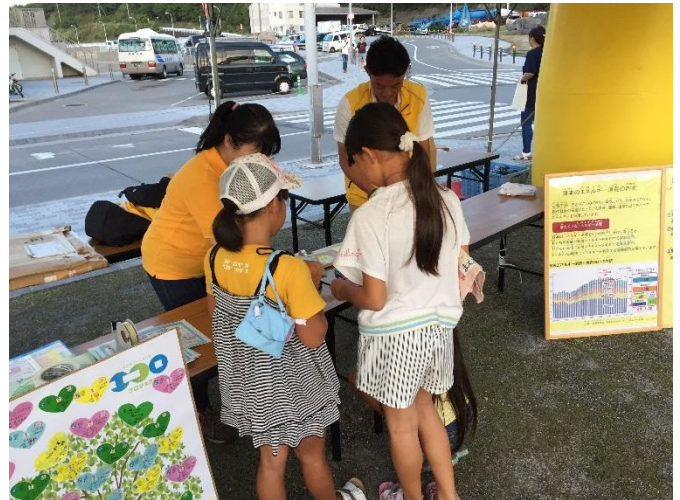
「環境によいこと宣言」記入中の様子