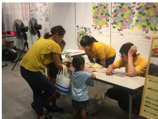
「環境によいこと宣言」記入中の様子