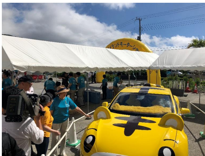
EVしまじろうカーについて説明を聞かれている小池都知事