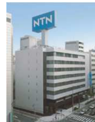
本社ビル（大阪市西区）

（For N ew T echnology N etwork：新しい技術で世界を結ぶ）