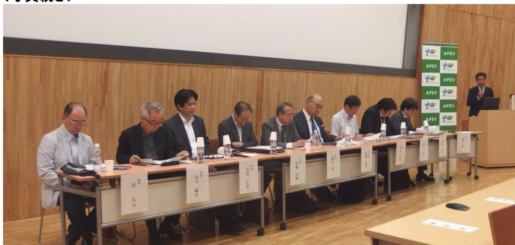
総会(理事、監事、顧問)