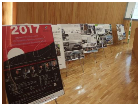
会場入り口に国際学生 EV デザインコンテストのポスター