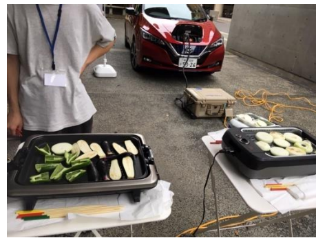
準備中のEVバーベキュー