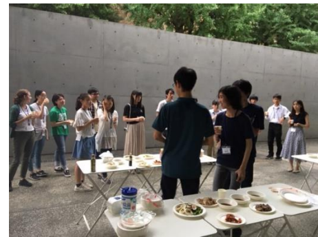
EVバーベキュースタート