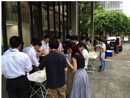
EVバーベキューの様子