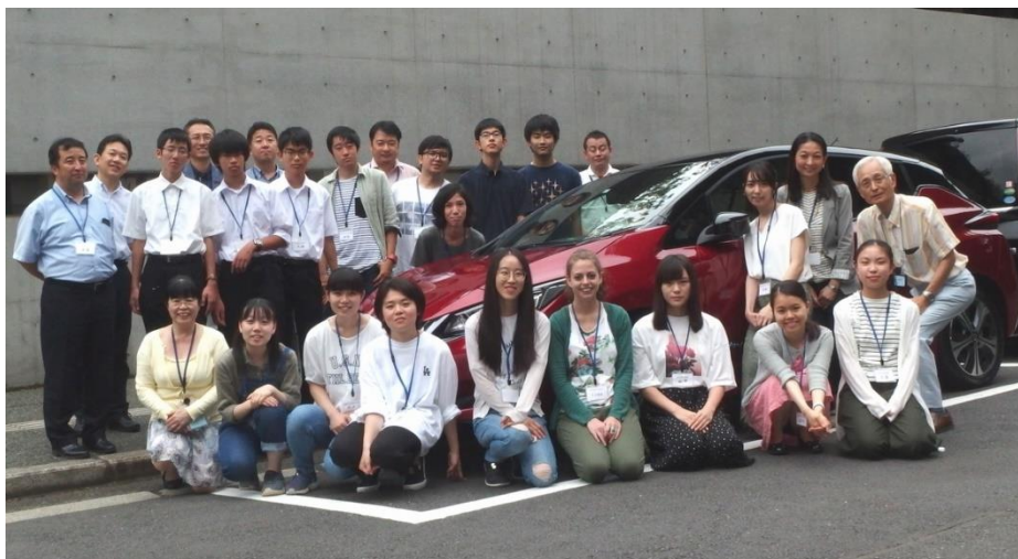
試乗やEVバーベキューでお世話になったEVを囲んで