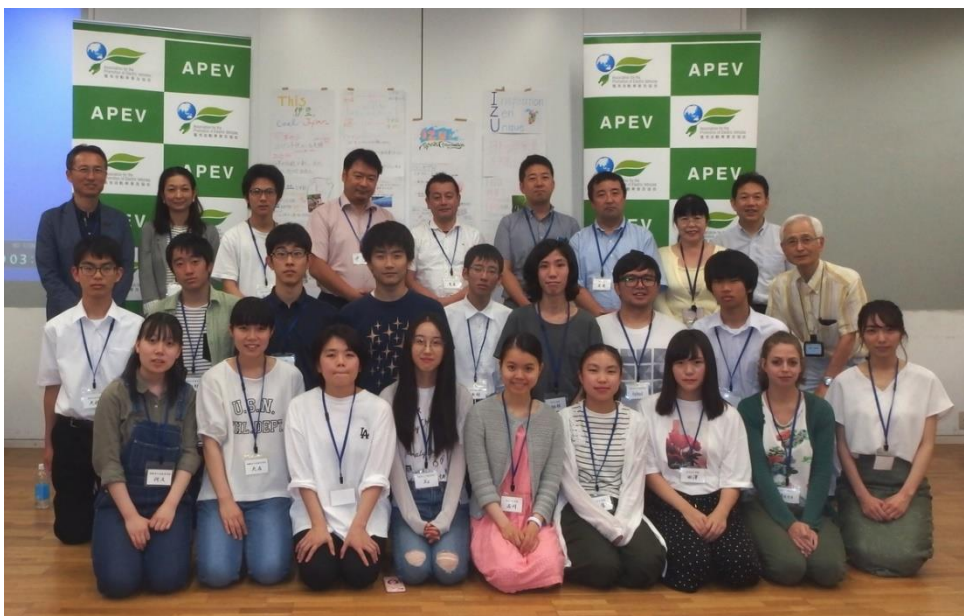
ご参加いただいた高校生とTA留学生、講師、スタッフの皆様