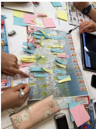
ツアー設計中の検討の様子