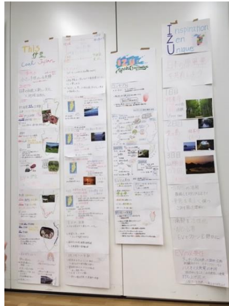
全チームのプレゼン