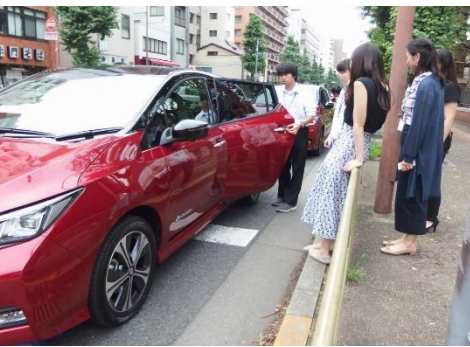
EV試乗する高校生たち