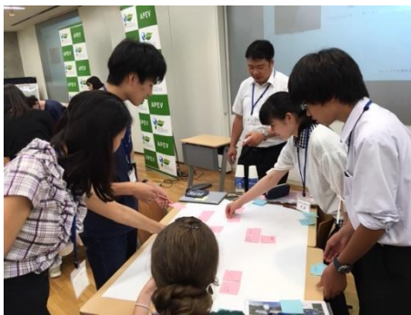
検討中の高校生たち