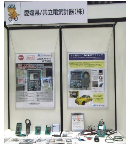
愛媛県産業技術研究所+(株)エム・コット+共立電気計器(株)