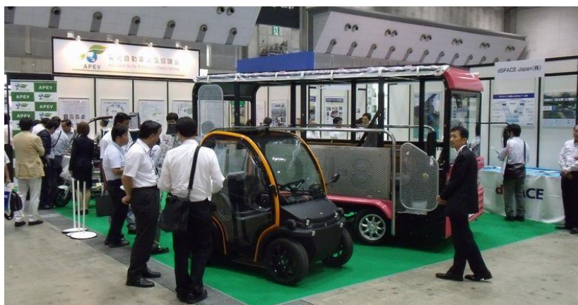
興和(株)+(株)シントウギャザー