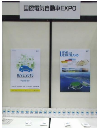
国際電気自動車 EXPO 韓国