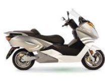
ベクトリックスジャパン 「VX-1」