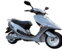
プロスタッフ 「プロッツァ EV-R55」