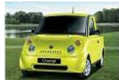
NAFCA 「AD-MOTORS CHANGE」