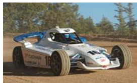
横浜ゴム 「HER-02」 (EV Sport Concept)