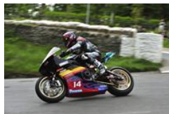
プロスタッフ 「プロッツァ TT 零-11」 (ティーティーゼロイレブン)