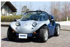
みちのくトレード 「シャープシューター」